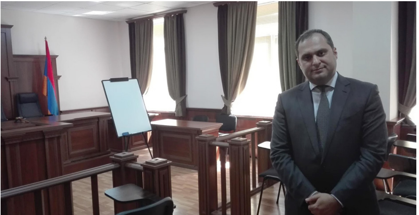
Հայաստանի Հանրապետության Փաստաբանների պալատի նախագահ Արա Զոհրաբյան

Իր հայտարարության մեջ Քաղաքացիական համերաշխության հարթակը նշել է.